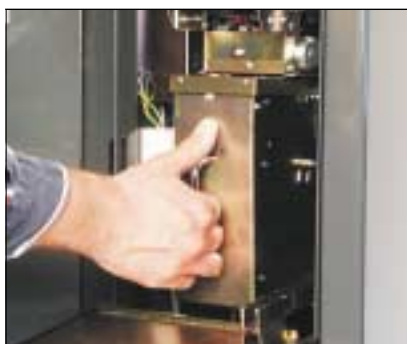
Unikt kassettsystem för enkel och säker tömning av pengar.