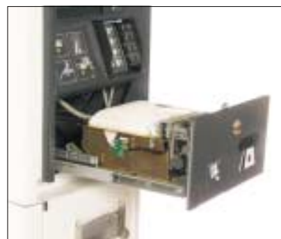
Lätt åtkomlig och snabb kvittoskrivare med sax och plats för stor pappersrulle.