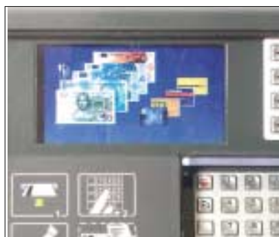
Tillvalet grafisk färgdisplay för information och vägledning av kunderna ger fantasin större möjligheter.