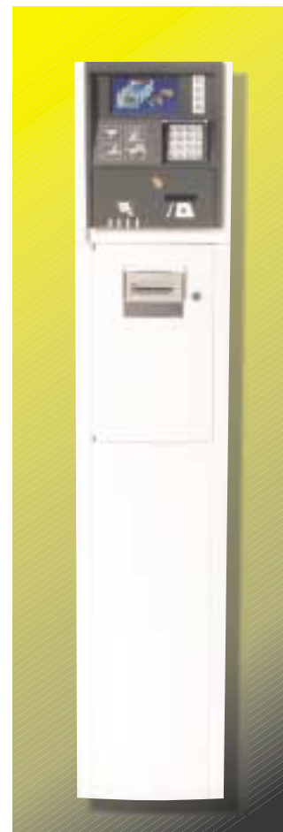
Bilderna visar produkter extra-utrustade med färgskärm och funktionstangenter.